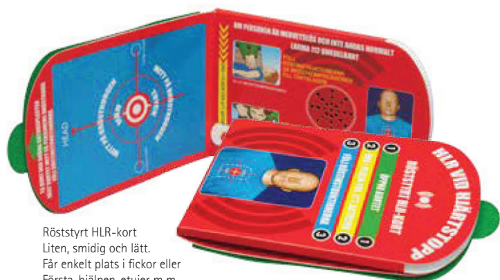
Röststyrt HLR-kort Liten, smidig och lätt. Får enkelt plats i fickor eller Första-hjälpen-etuier m.m.

Baserad på enkel "spelande-gratulationskorts-teknik" ger detta kort röststyrda instruktioner till användaren att ta bort den gröna skyddsplasten och att placera kortet på personens bröstorg enl markeringar på kortet. Därefter ges instruktioner för hur man utför HLR; bröstkompressioner och inblåsningar. Illustrationerna och textinstruktionerna på kortet ger ytterligare hjälp vid HLR.