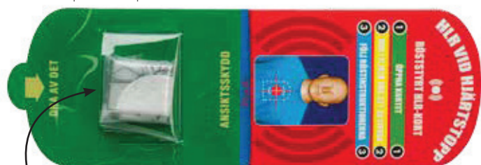
Det gröna skyddet dras av och kortet placeras på bröstkorgen. Använd ansiktsskyddet då du ska inblåsningar.