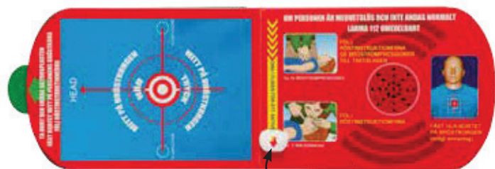
Illustration som visar var på bröstkorgen kortet ska placeras innan bröstkompressioner ges. En ljudmetronom hjälper till att hålla taktan på bröstkompressionerna.