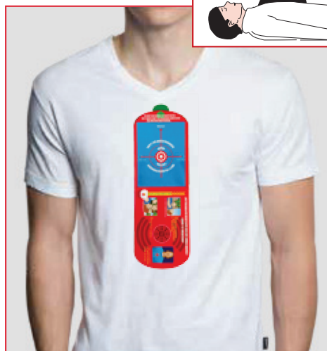
Tack vare klistret på kortet och den tydliga illustrationen är det enkelt att placera kortet rätt på bröstkorgen.