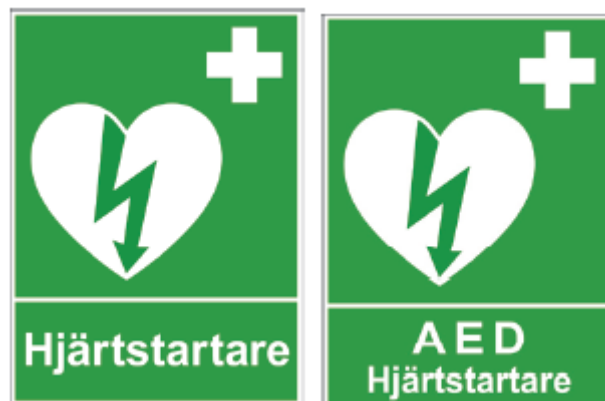
Figur 1— Exempel på skyltar enligt HLR-rådet

Hänvisningsskylt(ar) ska finnas i den utsträckning som motiveras av lokalers storlek och avstånd till hjärtstartaren.